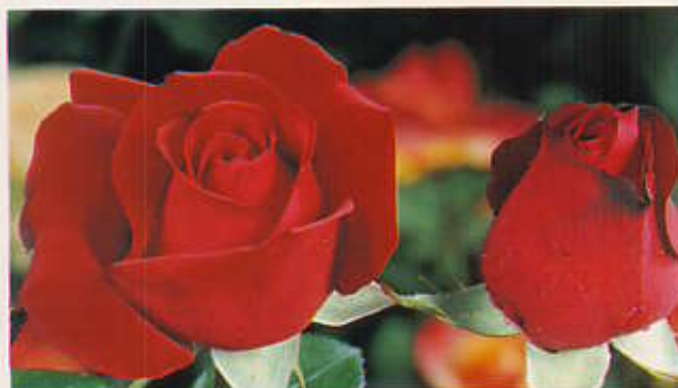
F Ingrid Bergmann