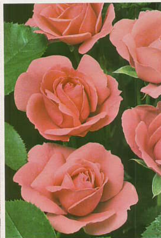
M Tip Top.