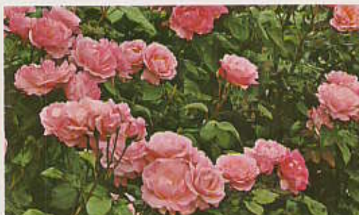
Q Queen Elizabeth.