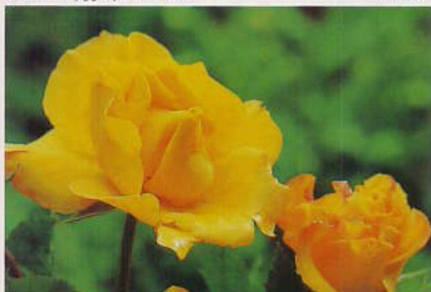
Gold Marie 70 cm. Busket vekst med mørkegrønne læraktige blad. Gullgule, fylte blomster. Riktblomstrende med god duft. Sol/halvskygge. Juni/oktober.