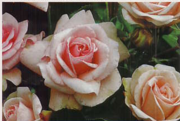
Dronning Margrethe 50cm. Veksten er lav, tett og kompakt med mørkegrønne, skinnende blad. Lett lyserøde blomster. Duftende. Sol/halvskygge. juni/oktober.