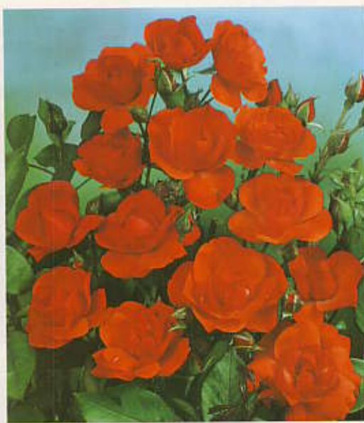
J Orange Sensation.