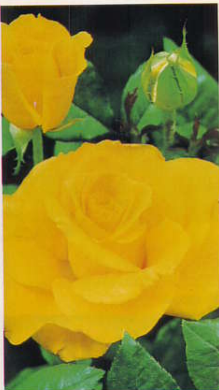
C Peer Gynt