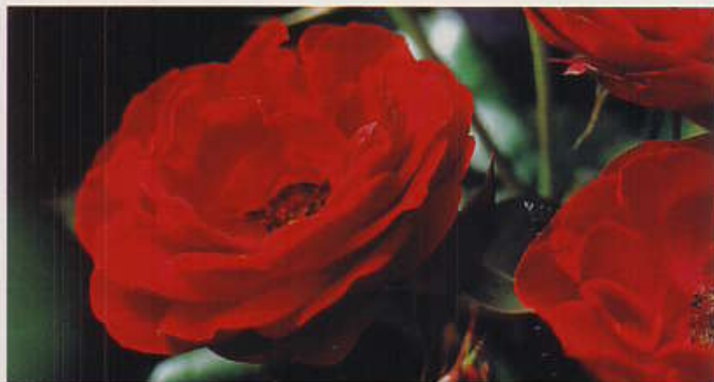
Christian IV 70 cm. Blomsten er flat, mellomstor, lysende mørkerød i buketter. Lett duftende. Sol/halvskygge. juni/oktober.