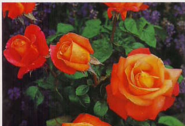
Troika 70 cm. Kraftig og busket vekst med skinnende mørkegrønt bladverk. Blomsten er stor og fylt. Bronsefarget med rødt. Sol/halvskygge. Juni/oktober.